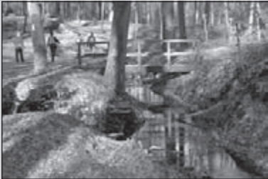
Omgeving Arnhem slaat alles