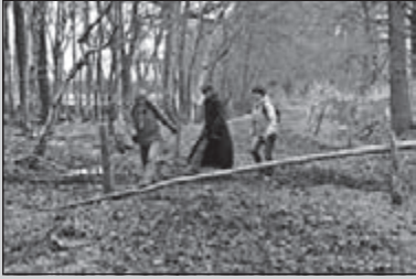
Mooie tocht in De Mierden

CLUBBLAD VAN WSV OLAT • JAARGANG 35 • NUMMER 3 • MAART 2009