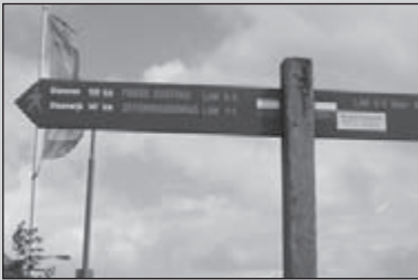
Het Friese Kustpad